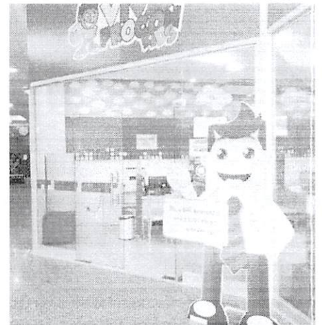
Novo posto de atendimento da BRK Ambiental, no Shopping Passeio

Como nas demais lojas de atendimento da concessionária, o cliente poderá efetuar pagamentos de faturas, emissão de segunda via, solicitação de reatuação, cadastro de ligações, abertura de ordem de serviços, alteração cadastral e parcelar seus débitos. Desde o início da atuação, a BRK Ambiental melhorou o índice de atendimento em água que, em 2015 era de 38% com 182 mil pessoas atendidas, aumentando esse índice para mais de 82% da população, e atende hoje a aproximadamente 390 mil pessoas. "Já realizamos mais de 570.000 ordens de serviço nas duas cidades de atuação, trazendo melhorias contínuas para a população. Inicialmente resistente, hoje grande parte da população ribamarense e limnesse agradece por ter água 24 horas em suas torneiras e sem a necessidade de rodízios", finalizou Pavezi.